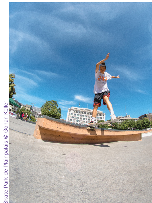
Skate Park de Plainpalais

tionnées! La finale, diffusée en livestream (en raison des contraintes sanitaires), a permis aux six finalistes: Dark Queen, Silance, Céline & Kay Yoko, Cali Guz et Isia, de se produire sur la scène de la Villa Tacchini (Lancy), devant un jury de professionnelles actives dans le milieu de la musique. Marraine du concours et MC de la soirée, la chanteuse et DJ genevoise Mara, les accompagnait aux platines. Dark Queen a remporté la palme, grâce à son flow énergique et engagé, interprété en tamil. La jeune artiste a été programmée à Transforme Festival en 2021 et fera la première partie d'un concert dans le cadre d'Antigel en 2022. Transforme l'accompagne également dans la production de son prochain clip.