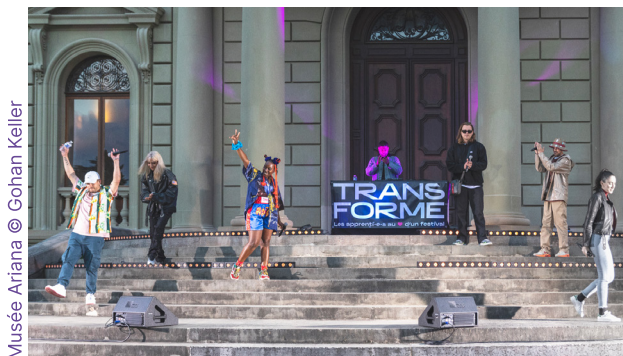
Musée Ariana © Gohan Keller

En partenariat avec l'association GVASK8 et les magasins Tranzport et BlueTomatoe, un concours de skate féminin a été organisé au Skatepark de Plainpalais. Associant les dimensions sportives, culturelles et sociales, l'événement était gratuit et ouvert à toute et tous. Majoritairement pratiquées par des hommes, les disciplines urbaines connaissent aujourd'hui un extraordinaire essor auprès des femmes. L'événement était donc l'occasion de faire la part belle aux filles qui évoluent dans ce milieu à Genève. La gagnante a bénéficié d'une année de sponsoring par le célèbre magasin BlueTomatoe. Transforme a, de son côté, récompensé 3 skateuses en leur offrant des billets pour le Festival. Des DJ se sont relayées aux platines toute l'après-midi, combinant deux disciplines phares de la culture hip-hop: le skate et le djing. Un stand de skateboard et de personnalisation de grips était tenu par NK Manufacture, jeune entreprise créée par un menuisier fraîchement diplômé du CFP Construction. L'association La Rose des Vents, œuvrant en faveur de l'intégration des femmes exilées, assurait l'espace nourriture & boissons.