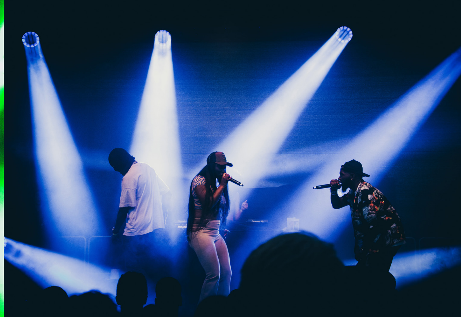
Le Juiice