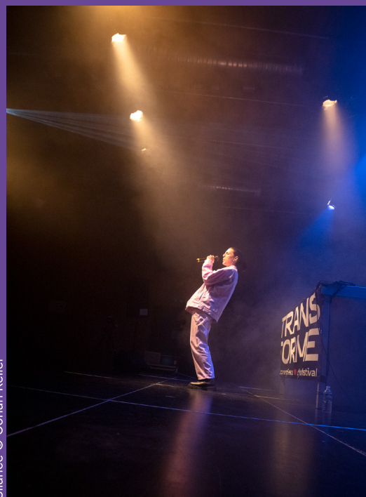
Silance © Gohan Keller

Dès les débuts de la pandémie, Transforme a mis en place de nouveaux formats de diffusion dans le but de continuer à offrir une visibilité aux artistes locaux·ales et bien sûr garder le lien avec le public et les apprenti·e·s genevois. Le but: multiplier les opportunités de rencontres culturelles grâce aux outils numériques.