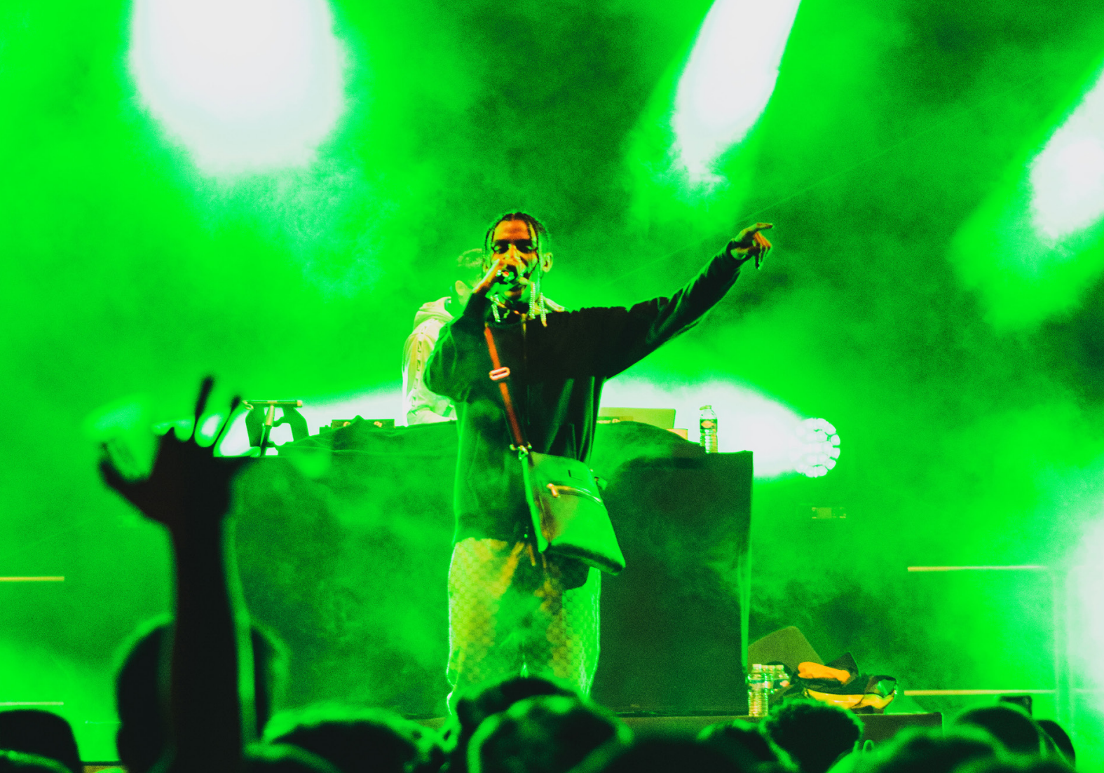
Luv Resval