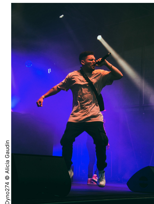
Dyno274 © Alicia Gaudin

Les artistes ont retrouvé leur public, le public a retrouvé ses artistes, les jeunes ont retrouvé d'autres jeunes et Transforme a porté haut le flambeau de la culture hip-hop !