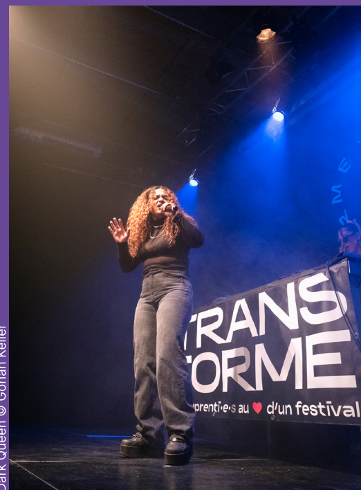
Dark Queen

Le tremplin Transforme est devenu incontournable! Chaque année, ce concours de musiques urbaines destiné aux jeunes artistes de la région recueille de nombreuses candidatures. Les femmes ont toutefois été les grandes absentes des deux premières éditions. Transforme a donc décidé de réserver l'édition 2021 aux artistes féminines et faisant partie de minorités de genre afin de légitimer leur place dans le paysage hip-hop. Plus de 50 candidatures ont été récep-