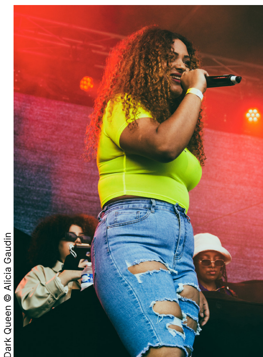
Dark Queen © Alicia Gaudin

Le jeune Prince Sith, Luv Resval , a lui fait parler le côté obscur de la force et entraîné les festivalier·ère·s dans une danse hypnotique et énergétique. Cadeau inattendu, il est venu avec l'Empereur Alkpote en guise d'invité surprise.